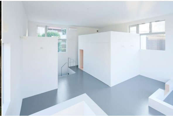
目白台の住宅 （メジロスタジオと協働）