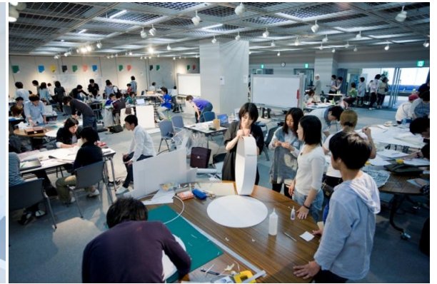
Hiroshima 2020 Design Charrette