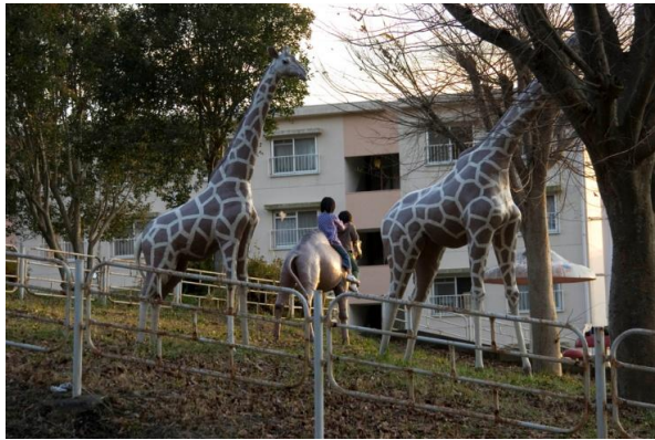
アノニマスな（無名な） 建物のつくられ方の研究