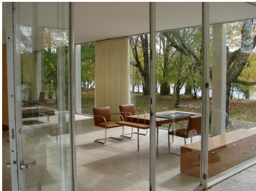
M i e s v a n d e r R o h e フ ァ ン ズ ワ ー ス 邸 , 1 9 5 1