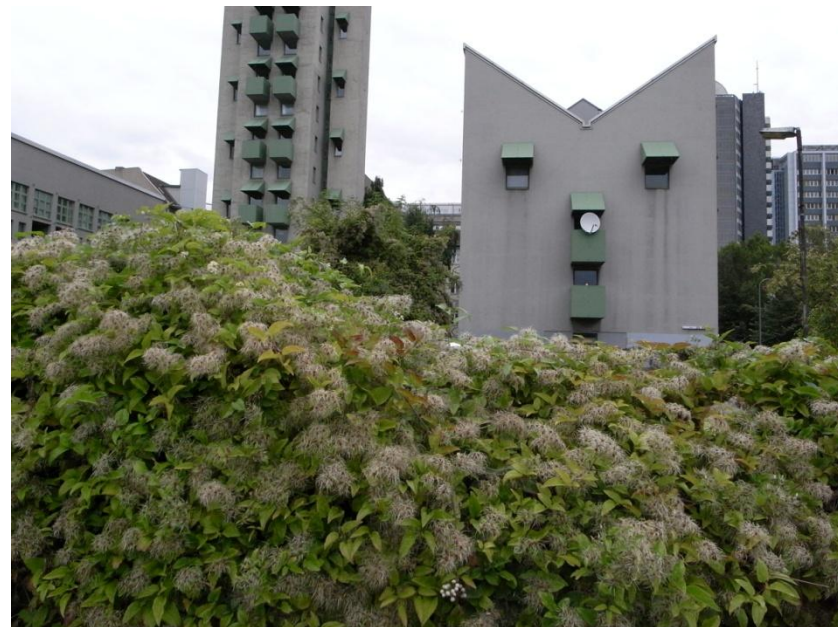
J o h n H e y d u k シ ャ ル ロ ッ テ ン 通 り の 集 合 住 宅 , 1 9 8 8